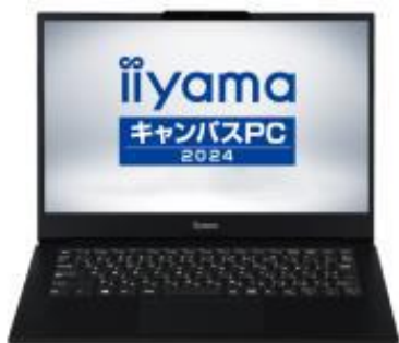
iiyama Campus PC