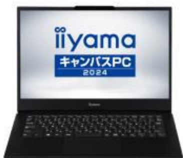
iiyama Campus PC