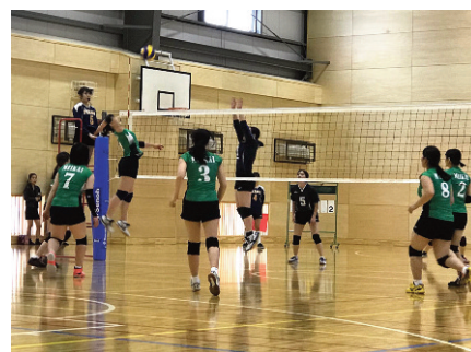
女子バレーボール部