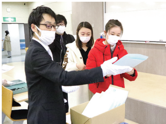
安全に考慮しつつ行われた学位記交付

といわれる密閉、密集、密接を避けるために各学科の学位記交付時間と交付場所が重ならないように設定し、各会場にアルコール消毒液を設置。卒業生が学位記を受け取る際に行列ができないような配慮がなされた。学生らはわずかな時間のなかで友人や恩師とあいさつを交わし、別れを惜しんだ。