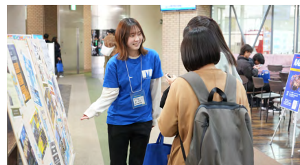
来場者に説明をする学生スタッフ

参加した高校生からは「学生も先生も非常に丁寧に対応してくださり、ぜひこの大学に入学したいと思った」といった前向きな感想が寄せられた。今後も、受験生たちが本学の学びをより深く理解できるような、有意義な情報発信やイベント開催を継続していく。