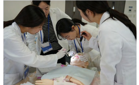
在宅高齢患者を想定した口腔内チェックを行う檀国大学校の研修生たち

歯科衛生士の役割や養成教育に関する知識を深めた。ベトナムでは歯科衛生士の国家資格が存在しないため、研修に参加した歯科医師たちは、歯科医師と歯科衛生士の役割分担や協力体制に特に強い関心を示していた。