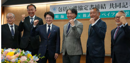
共同記者会見の様子