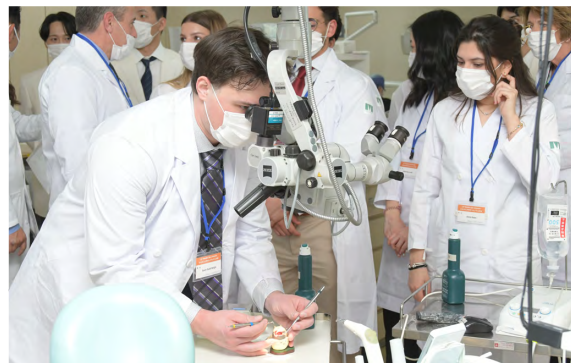
ロボットシミュレーションシステムを体験するアラバマ大学バーミングハム校(写真左)と本学の設備を活用し歯科治療を学ぶテキサス大学サンアントニオ校(写真右)の研修生たち