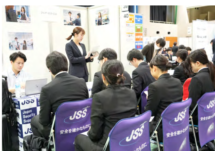
企業の採用担当者から説明を受ける学生たち

開催した。本セミナーは、学生が幅広い業界への理解を深め、就職活動に向けた視野を広げることを目的として実施しているもので、今回は2日間で約160社が参加した。初日は体育館に80社が集まり、各ブースでは企業担当者から事業内容や仕事の魅力、求める人材像などについて直接説明が行われた。