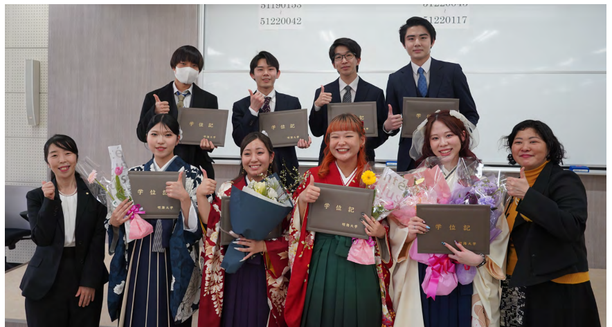
晴れ着に身を包んだ卒業生と教員が記念撮影

また、閉式後には、壇上で理事長、学長、副学長、各学部長、学科主任をはじめとする教員らが卒業生一人ひとりに記念の花を贈呈し、教員と学生が直接言葉を交わしながら、感謝の思いを伝え合う温かなひとときとなった。