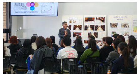
ホスピタリティ・ツーリズム学科魅力発見コーナーの様子