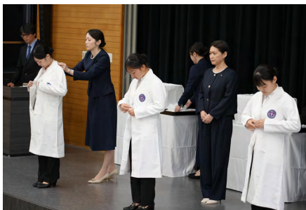
白衣に袖を通す学生たち

保健医療学部口腔保健学科1年生を対象とした「ホワイトコートセレモニー（白衣授与式）」が6月21日に浦安キャンパスで開催された。ホワイトコートセレ