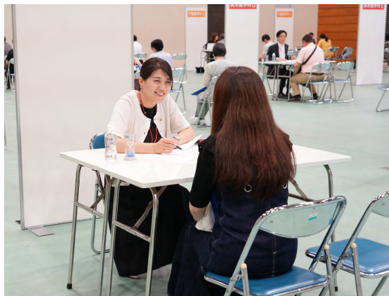
個別面談会の様子

続く個別面談会では、学科担当教員が成績や大学生生活の相談に応じた。保護者からは「先生から直接お話が聞けて安心した」「インターンシップや資格取得の重要性がわかったので、早い段階から準備をさせたい」などの声が聞かれ、非常に有意義な機会となった。