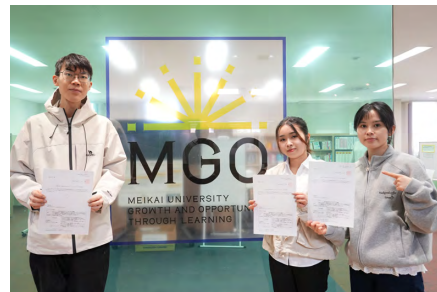
修了証明書を手にする留学生たち

リースート添削、面接対策などの支援を受けながら、日本企業への就職と希望進路の実現をめざしていく。