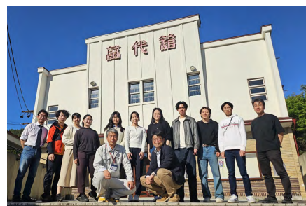
地域の象徴である「萬代館」の前にて記念撮影

今後は8月、9月、2月にも現地訪問を予定しており、さらに深掘りした調査と具体的な提案を行う。地域・行政・大学が一体となり、宿場町の未来に向けて継続的な取り組みを推進していく。