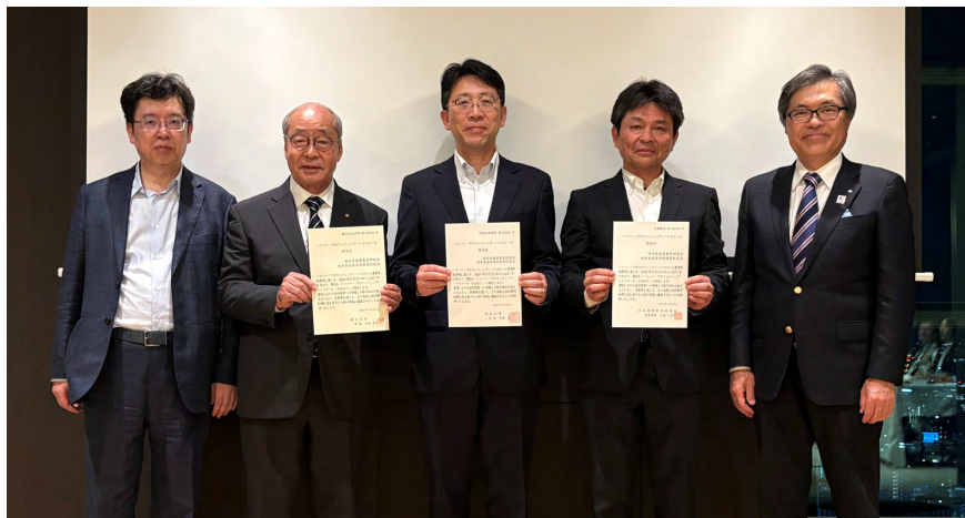
ハイパー・アカウンティング・ハイスクール指定証交付の様子

本学は2027年4月、難関国家資格である公認会計士の合格をめざす「体育会会計研究部」を始動する。経済学部のカリキュラムと連携した学習プログラムを軸に、現役の公認会計士による個別指導体制を整備。学生が疑問点を随時相談できる環境を提供する。講師