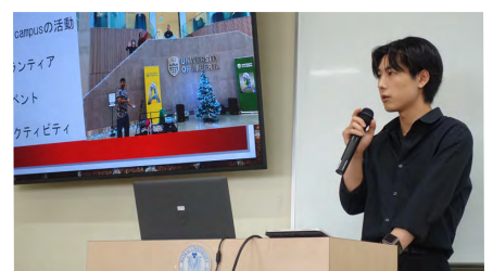
アルバータ大学(カナダ)での留学経験を発表する学生