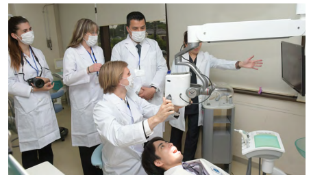
付属病院を見学するトゥルク大学の学生・教員

(※)交換研修プログラム: 本学歯学部は国際的な歯科医師を育成することを目的に、費用全額大学負担の海外研修制度を設けるとともに、海外姉妹校から交換研修生を受け入れている。