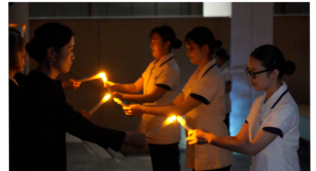
キャンドルに灯火を受ける保健医療学部生

いかなことも皆さんの学びになります。誓いの言葉を胸に、医療従事者の原点を振り返ってみてください」とメッセージが贈られた。