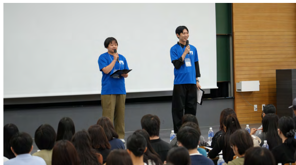
オープニングガイダンスで司会を務める学生

好評を博した。参加した高校生からは「大学の雰囲気がよくわかり、受験へのモチベーションが上がった」との声が寄せられ、夏以降も受験生に寄り添った有意義なイベントを継続していく。