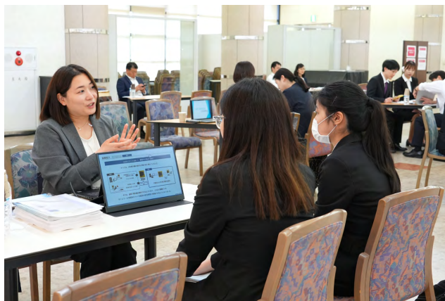
採用担当者の話を熱心に聞く学生たち