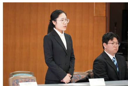
インターンシップ報告会の様子

た。本学では、こうした実社会とつながる学びの機会を提供し、学生の主体的なキャリア形成を支援している。