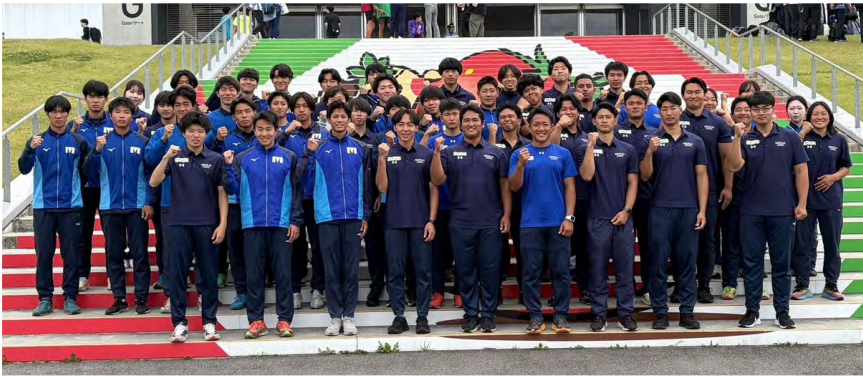
陸上競技部の部員たち

(大会成績) 男子2部総合 5位 (55点) 男子2部フィールド総合 3位 (48点)