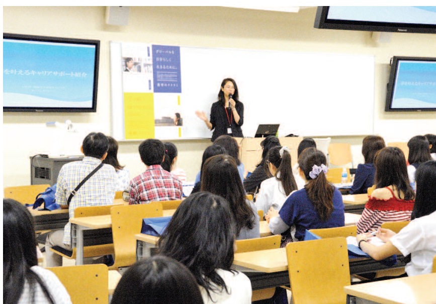
好評を博した特別プログラム