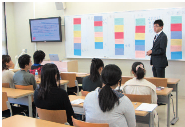
日本語学科One Dayセミナーの様子

OGによるパネルディスカッション、エアライン・ホスピタリティマーケティングに関する講座