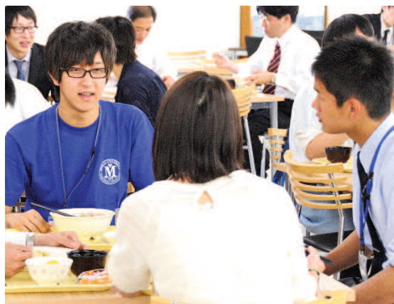
在学生と歓談しながらの昼食

5月25日、坂戸キャンパスにおいて2014年度最初のオープンキャンパスが開催され、歯学部を志望する高校生や保護者が多く参加した。大学紹介では、本学の臨床力を重視した教育システムや入学試験に関する説明が行われた。その後、キャンパスツアーや学食体験では、学生スタッフと談笑する様子や、入学後の学生生活について熱心に質問する姿が見られた。来場者からは「海外研修制度やカリキュラムが大変充実していることがよく分かった。ぜひ入学してこのキャンパスで学びたい」「臨床力の高い歯科医師になるための環境や設備が整っていると感じた」などの声が聞かれた。