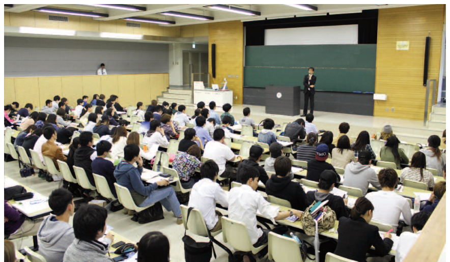
満席となったガイダンスの様子

せていることの重要性について解説があった。真剣な表情で講演に耳を傾け、メモを取る参加者たちからは、就職活動にかける熱意が早くも感じ取れた。