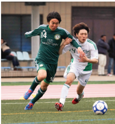
体育会サッカー部

5月18日に開催された千葉県大学サッカー選手権大会兼総理大臣杯千葉県代表決定戦の決勝において、本学体育会サッカー部が国際武道大学