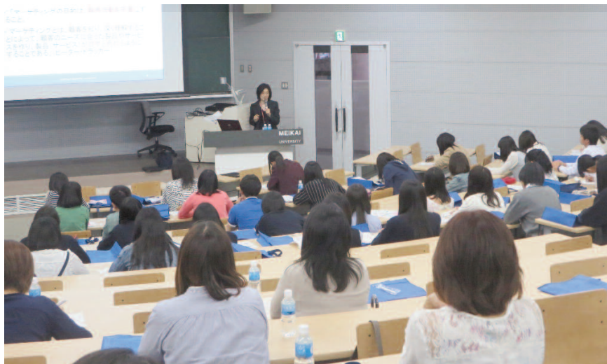
ホスピタリティ・ツーリズム学科One Dayセミナーの様子

オープンキャンパスとは異なり少人数定員制のため、教員や在學生とコミュニケーションがしっかり取れることも魅力のひとつ。参加した高校生たちは、体験学習やグループワークなどを通じて初対面の参加者同士で打ち解け、楽しそうに会話をする姿や、教員や在學生に将来の進路や大学生活について質問する姿が見