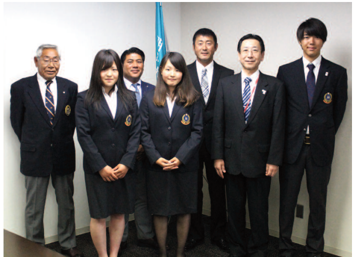
イタリア出発に向けて学長を表敬訪問した選手たち

の力が出せば自ずと結果はついてくる。また、3人は年齢的に来年も狙えるので、今年限りではなく、次も狙えるように積極的にチャレンジしてほしい」、國府田由隆監督は「2020年の東京オリンピックに繋げていくためにも、世界の壁を知ってきてほしい」と語った。