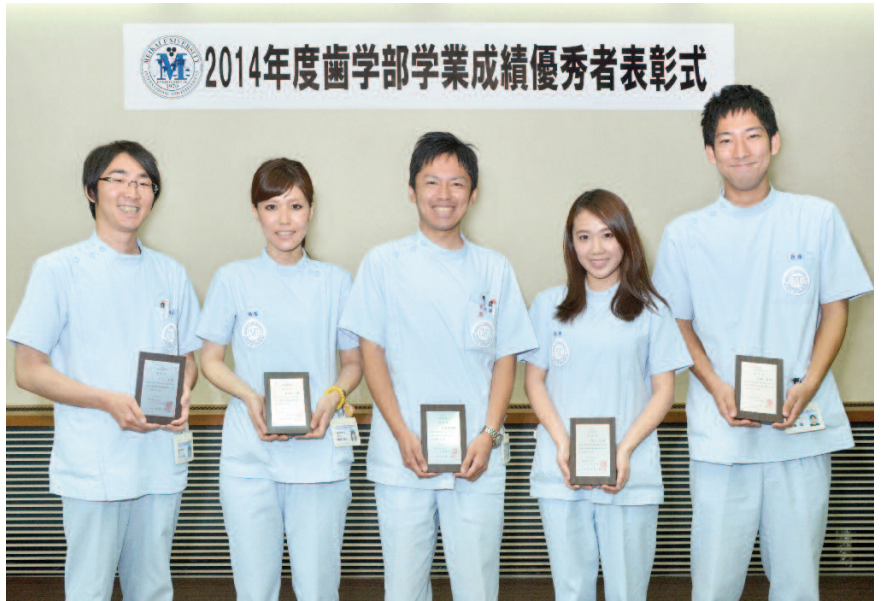
パーフェクト受賞の学生たち