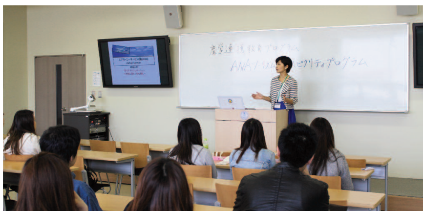
「航空サービス論」の授業風景

ているのでこのプログラムを履修しました。この機会にしっかりと知識を身につけ、必ず夢を実現させたいと思います」と、やる気に満ち溢れていた。