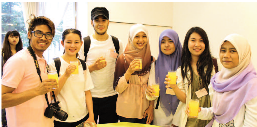
笑顔の外国人留学生

参加した新入留学生は「入学した時はとても緊張していましたが、今ではたくさんの友達ができました。日本の伝統文化に興味があるので、茶道や華道を習ってみたいです」と笑顔で今後の展望を語った。