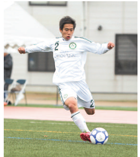
体育会サッカー部