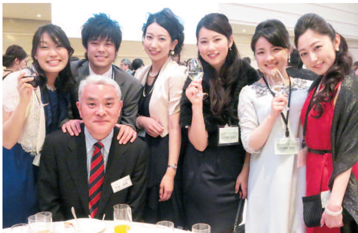
恩師や友人と楽しいひと時を過ごした卒業生たち