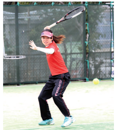
体育会女子硬式庭球部