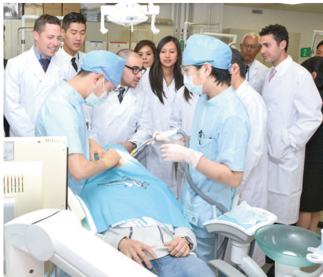
本学学生の高度な臨床技術を見学するUCLAの研修生たち

交換研修生を受け入れている。3月は協定校であるアメリカの3大学から研修生が来学し、交流を深めた。