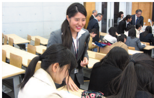
グループワークでアドバイスをする在学生