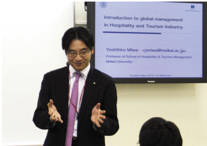
GMM：英語による体験授業

3月26日、ホスピタリティ・ツーリズム学部(以下、HT学部)ホスピタリティ・ツーリズムメジャー(以下、HTM)とグローバル・マネジメントメジャー(以下、GMM)のOne Dayセミナーが、浦安キャンパスで開催された。これは、学部の特色を活かしたさまざまな体験・参加型プログラムを通じて学部の魅力や学びの楽しさを知り、興味を深めてもらうことを目的に行っている。オープンキャンパスとは異なり、少人数定員制のため、在学生や教員としっかりコミュニケーションがとれることも魅力のひとつ。