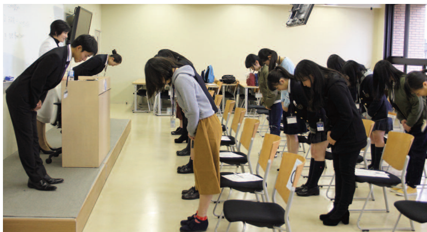
HTM：マナー講座でのお辞儀の練習

参加した高校生からは、「実際に参加してみて、大学のイメージをつかむことができた」「明海大学での勉強のことに、ホテルやエアライン業界のことが知ることができて、良い経験になった」「セミナーに参加して大学への興味がより深まった。入学して実際の授業を受けてみたい」といった声が聞かれた。また、同行した保護者からは、「春休みのセミナーなので、早い時期から子どもに大学選びを意識させることができた」「先生と学生の距離の近さを感じ、娘が入学したら充実した学生生活が過ごせるのだろうと想像することができた」などの感想があり、大変好評だった。