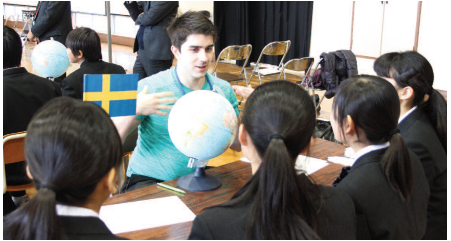
留学生交流会の様子

今回の交流会は、竹の塚中学校の1年生を対象として、本学の外国人留学生や英語ネイティブ教員と英語でコミュニケーションをすること