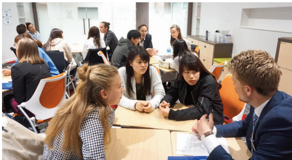
MPPECで行われたグループワークの様子

ワイトボードが設置されており、グループワークやプレゼンテーション等さまざまなスタイルに対応可能。