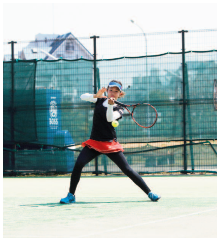
体育会女子硬式庭球部