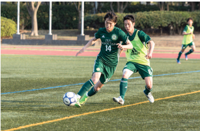
体育会サッカー部

課題は山積みで、まだまだこれからのチームだが、4年間継続して練習することで必ず成果は表れる。1人でも多く日本および関東学生陸上競技対抗選手権大会に出場できるように、練習を積み重ね、実力をつけていきたい。また、大会では入賞・優勝をねらっていきたい。