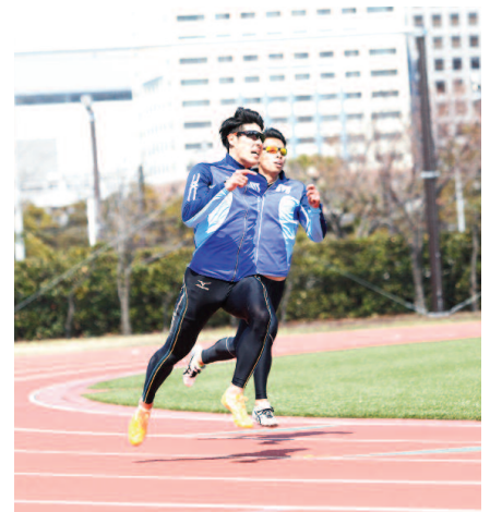
体育会陸上競技部