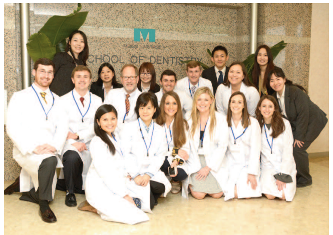
アラバマ大学バーミングハム校の研修生ら

の歯科医療に触れることができ、貴重な経験となった」「付属病院内の診療室は明るく、非常に良い雰囲気だと感じた」「日本人のおもてなしの精神に感動した」といった声が聞かれるなど、実りある研修となった。