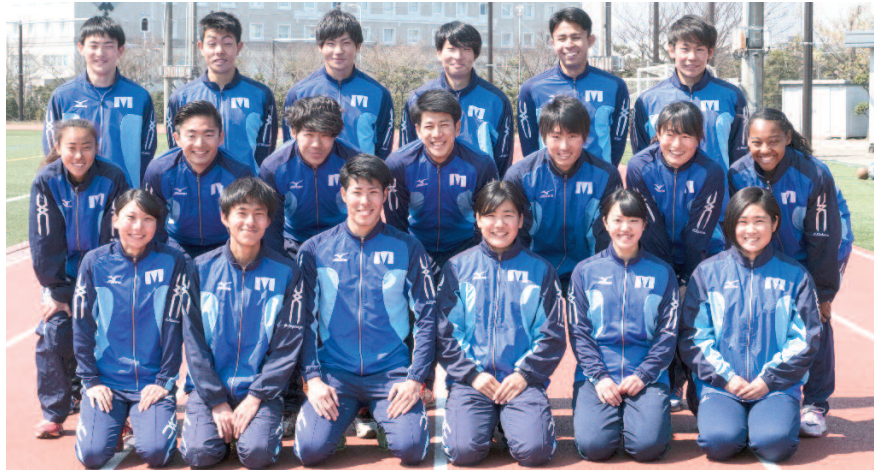
体育会陸上競技部

分の走りができ、全てのレースで自己ベストを更新することができた。齊藤もこれまでのような大会前の大きな緊張は見られず、良い状態で大会に臨めた。来年は優勝をめざし、練習に励んでほしい」と話した。