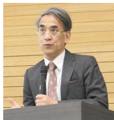
文部科学省高等教育局審議官 浅田和伸氏による講演

また、HT学部客員教授でハワイ大学のラッセル・ウエノ教授からは、「アメリカの大学における21世紀型教育モデルと留学メリット〜ハワイ大学の取組み」と題し、ラーニングコモンズ・メーカースペースといった最新の教育施設を活用したアクティブラーニングや、ICT技術導入による学生のための付加価値提供についての事例紹介のほか、