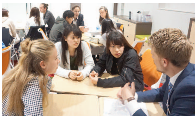
MPPECでの意見交換の様子

の授業を参観。続いて、英米語学科の授業に参加し、教員免許を取るためのシステムや学校教育の現状などについて、互いの国の状況について英米語学科の学生と活発に情報交換