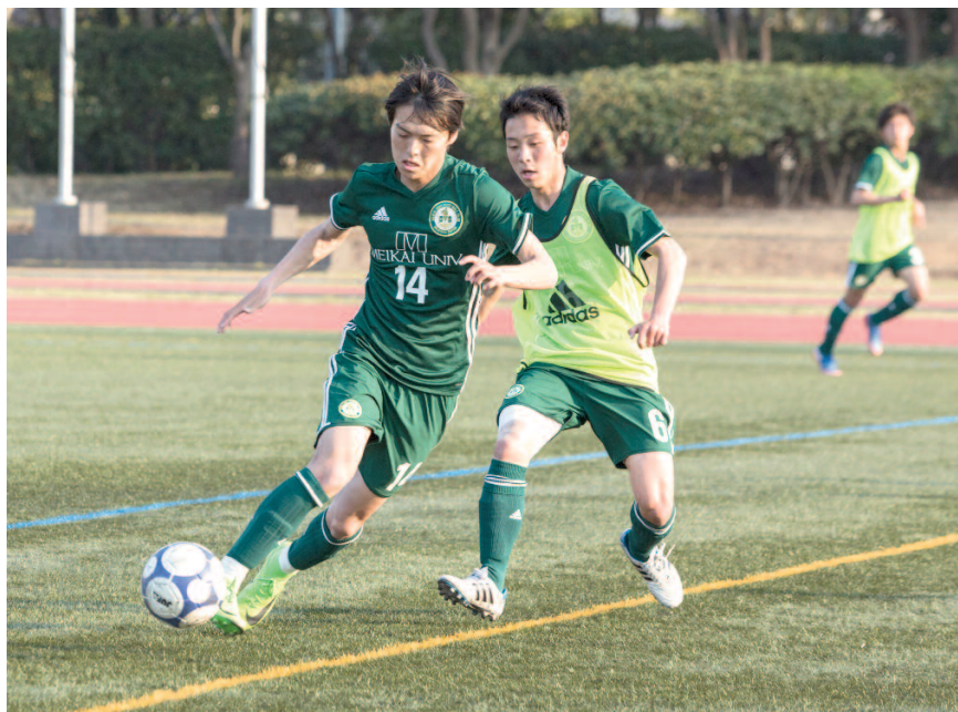
体育会サッカー部

て、体育会サッカー部は4勝1敗1分と、首位での折り返しに向け巻き返しを図っている。これまでの結果