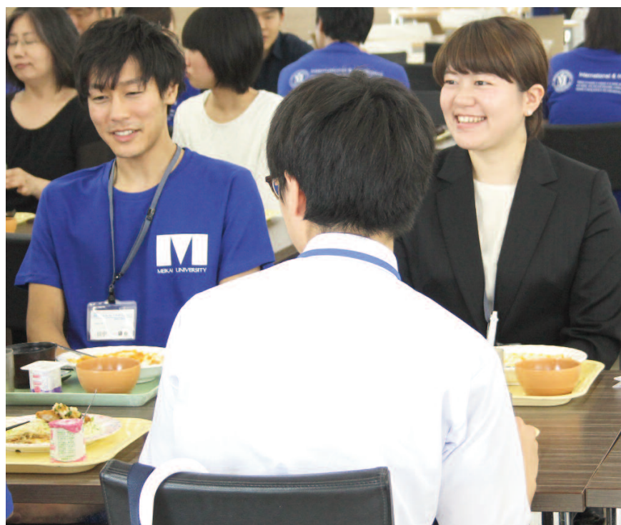
在学生と気軽に話せる学食体験