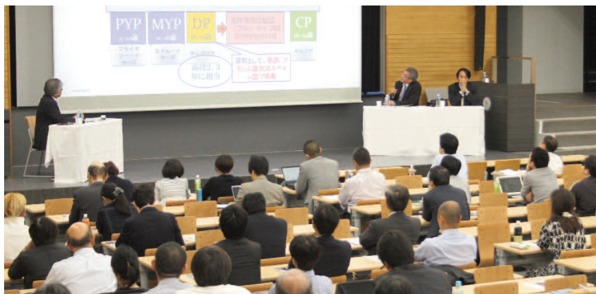
パネルディスカッションの様子

(※) 4技能英語教育：英語学習において、「聞く」「話す」「読む」「書く」の4技能をバランスよく育成すること。