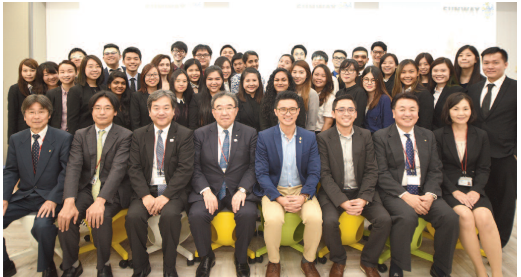
交流を深めたHT学部生とサンウェイ大学の研修生ら

5月12日から18日にかけて、マレーシアのサンウェイ大学ホスピタリティ学部の研修生35人が来日し、本学HT学部が研修をサポートした。本学とサンウェイ大学は、HT学部グローバル・マネジメントメジャー（以下、GMM）で必須となっている1年間の交換留学を実現するため、4月に学術協力に関する一般協定書を締結している。