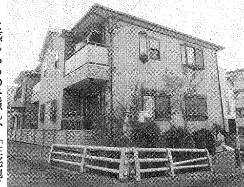
落ち着いた雰囲気のアパート

戸建て住宅と集合住宅の区別はない。この用途地域内であっても低層であれば集合住宅を建てることのできるということだ。